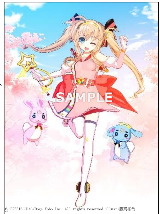
© BREETSCHLAG/Doga Kobo Inc. All rights reserved. illust:藤真拓哉